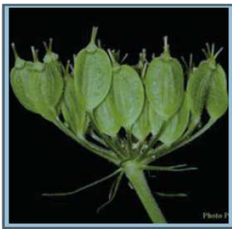
Photo des fruits de la Berce du Caucase (akènes)