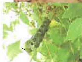
Chenille du sphynx