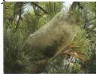
Cocon de chenilles processionnaires du pin