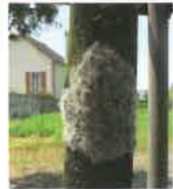
Cocon de chenilles processionnaires sur tronc