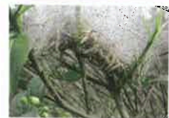
Cocon d'hyponomeute sur cerisier