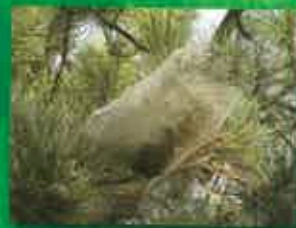
Processionnaires du Pin