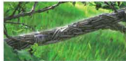
Cocon de chenilles processionnaires du chêne

> Leur nid (voir photo) peut être accolé au tronc, suspendu sous une branche ou encore installé au niveau des coupes d'élagage. Ces nids peuvent mesurer 15 cm à 1 mètre. Contrairement aux processionnaires du pin, elles passent l'hiver sous forme d'œufs. Les chenilles apparaissent en avril et commencent à construire les nids dans lesquels elles se nymphosent fin juillet puis se transforment en papillon fin août.