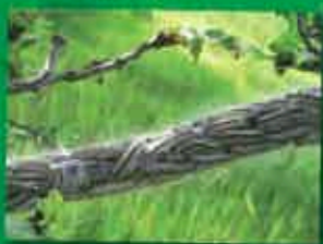
Processionnaires du Chêne