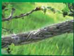
Processionnaires du Chêne