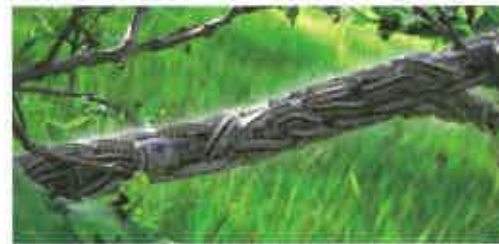
Cocon de chenilles processionnaires du chêne

> Leur nid (voir photo) peut être accolé au tronc, suspendu sous une branche ou encore installé au niveau des coupes d'élagage. Ces nids peuvent mesurer 15 cm à 1 mètre. Contrairement aux processionnaires du pin, elles passent l'hiver sous forme d'œufs. Les chenilles apparaissent en avril et commencent à construire les nids dans lesquels elles se nymphosent fin juillet puis se transforment en papillon fin août.