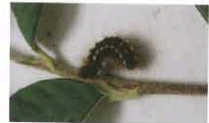
A gauche : Chenille bombyx cul brun Ci-dessous : Chenille du cossus gâte-bois

Dégâts : > Les feuilles sont perforées, mordues, soies urticantes.