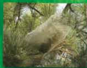
Processionnaires du Pin